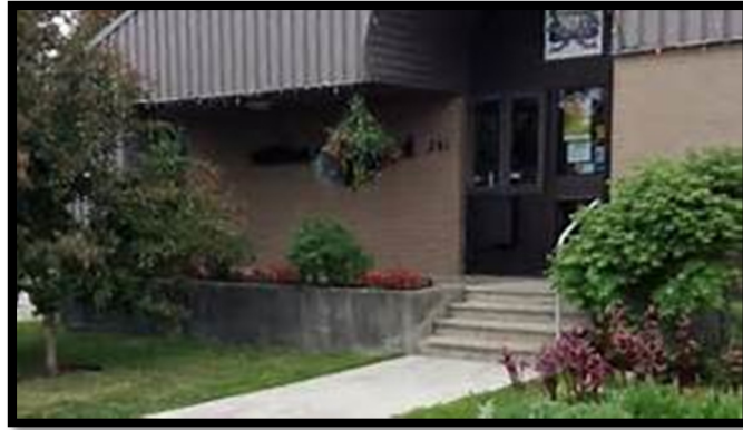
261, rue Principale, Saint-Antonin