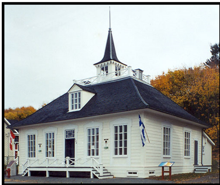
199, rue Saint-Jean-Baptiste, L'Isle-Verte