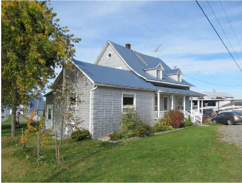
Le 70, 2 e Rang Est. IMG_2531.jpg