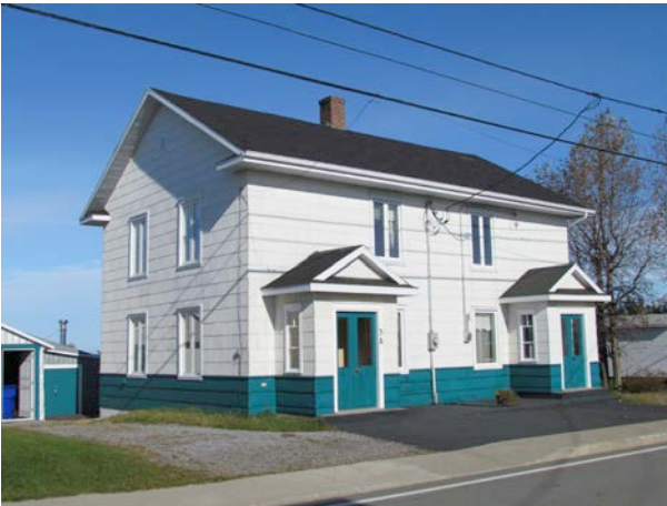
Le 34, rue Principale Ouest. IMG_2385.jpg

Le noyau villageois a vu son caractère patrimonial s'altérer. On y retrouve surtout des constructions anciennes rénovées où désormais les formes et les matériaux contemporains prédominent.