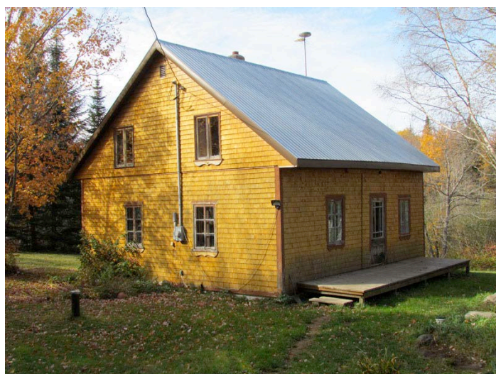
Exemple de maison de colonisation, 196, 5 e Rang Ouest, l'un des types les plus courants de la municipalité. IMG_2485.jpg