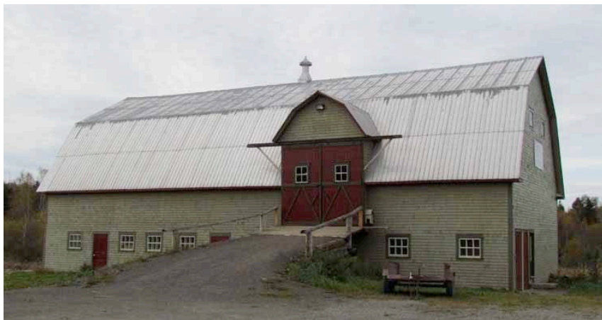
Le bâtiment secondaire rattaché à un ensemble agricole : une grange-étable au toit brisé. Le portail est recouvert de la même forme de toiture. 300, 4 e Rang Est. IMG_2682.jpg

En outre, un bâtiment secondaire, rattaché à un ensemble agricole a également été inventorié.