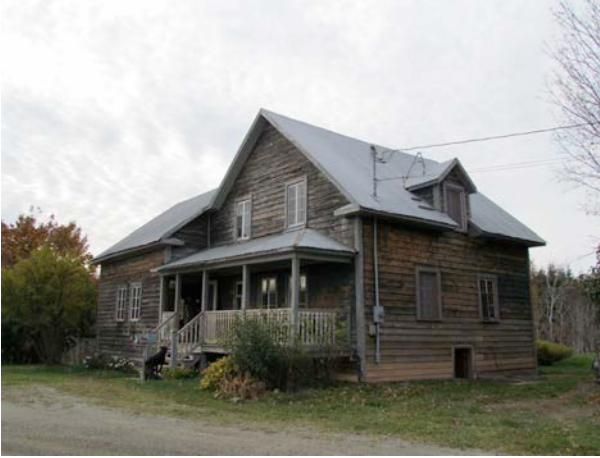
Le 180, 4 e Rang Est. IMG_2647.jpg

Même si le patrimoine bâti de Saint-Paul-de-la-Croix demeure modeste, il subsiste quelques bons exemples de préservation architecturale. De manière générale, le patrimoine bâti le mieux préservé se situe à l'extérieur du noyau villageois.