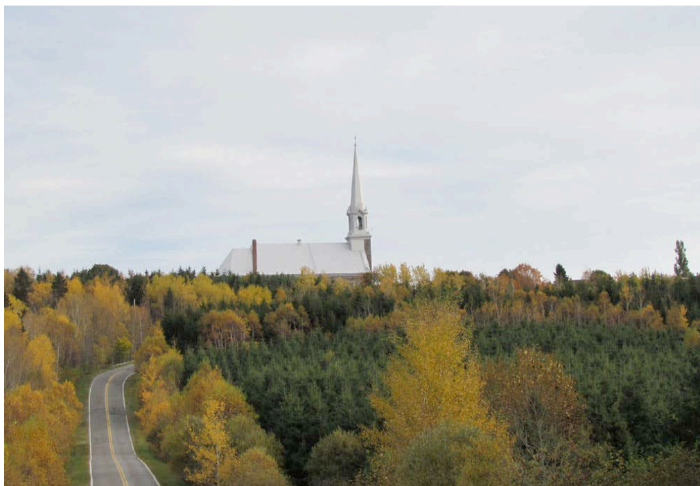
Eglise de Saint-Paul-de-la-Croix. IMG_2687.jpg

Au sud de la municipalité de L'Isle-Verte, l'église de Saint-Paul-de-la-Croix perce le paysage montagneux et attire le regard vers la municipalité, tout en caractérisant les lieux.