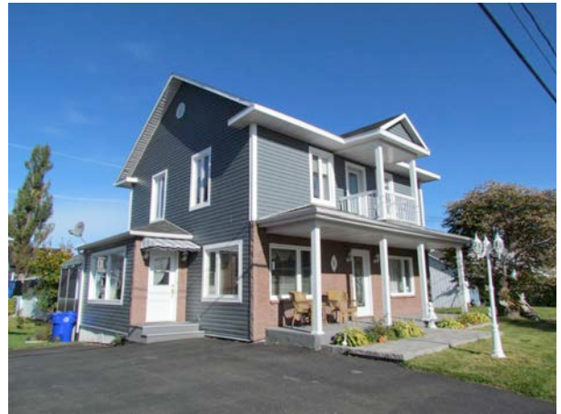
Le 6, rue Principale Ouest. IMG_2415.jpg

Néanmoins, plusieurs constructions présentent tout de même un potentiel patrimonial intéressant. Des changements mineurs comme le remplacement des fenêtres par un modèle plus traditionnel permettraient d'améliorer grandement la valeur patrimoniale du bâtiment. Voici quelques exemples d'édifices offrant un bon potentiel de mise en valeur.