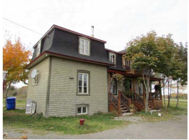
Le 300, 4 e Rang Est. IMG_2670.jpg

Le noyau villageois a vu son caractère patrimonial s'altérer. On y retrouve surtout des constructions anciennes rénovées où désormais les formes et les matériaux contemporains prédominent.