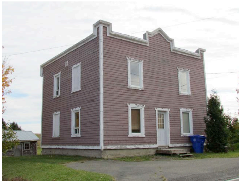
Le 9, rue Principale Est. IMG_2618.jpg