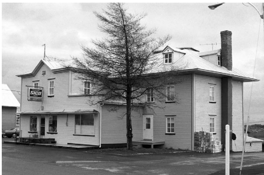
Le 9, rue Principale en 1977. Il se compose de deux bâtiments jumelés, l'un de style cubique, l'autre de style Regency. E6,S8,SS2,D77.2451,P37(35).jpg

Des édifices, comme le 9, rue Principale, ont subi davantage d'altérations que d'autres.