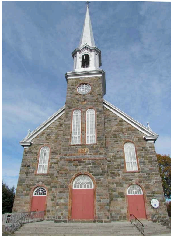
Église de Saint-Paul-de-la-Croix. IMG_2549.jpg