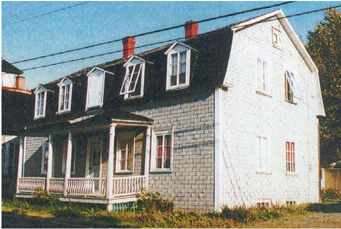
Le 203, rue Saint-Jean-Baptiste, démoli depuis 1990-1991. 203, rue Saint-Jean-Baptiste.jpg