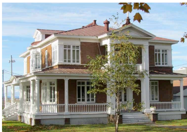
Presbytère de Saint-Jean-Baptiste de L'Isle-Verte localisé dans un site du patrimoine. IMG_3728.jpg