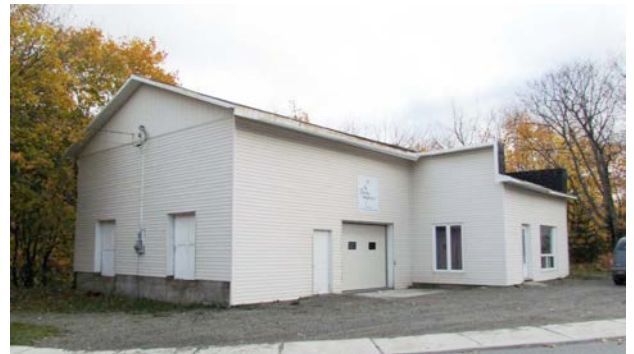
L'ancienne crèmerie (beurrerie) de L'Isle-Verte en 2011. Des fenêtres ont été obstruées, les revêtements anciens sont disparus, tout comme les garnitures de rive (planches cornières et chambranles). 35, rue Villeray. IMG_4418.jpg