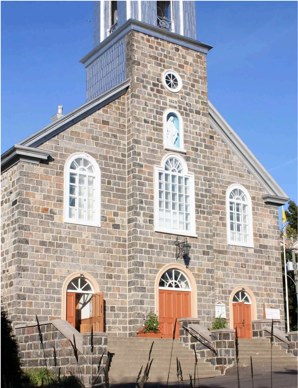
Église de Notre-Dame-du-Portage. IMG_7656.jpg