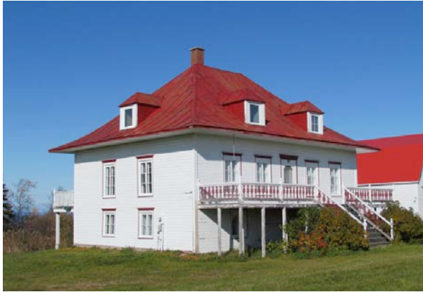
Le 679, chemin Pettigrew. IMG_4008.jpg

Un type architectural très rare dans la MRC de Rivière-du-Loup particularise L'Isle-Verte : le Regency. En effet, quelques beaux exemplaires de ce style se retrouvent encore parmi les bâtiments les mieux préservés de l'endroit, dont l'édifice de la Cour-de-Circuit-de-L'Isle-Verte, classé monument historique et décrété lieu historique national du Canada.