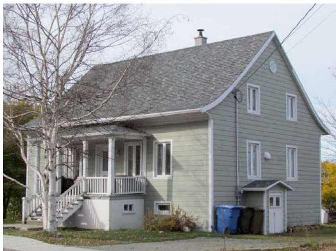
Le 274, rue Saint-Jean-Baptiste en 2011. Les fenêtres à carreaux sont disparues. Le revêtement de planches verticales a été remplacé par un clin d'aluminium. Un revêtement de planches verticales unies comparable à celui d'origine aurait été préférable. IMG_4867.jpg

Certains édifices n'ont connu que des modifications mineures. L'ancien couvent des Sœurs de Notre-Dame-du-Saint-Rosaire en constitue un bel exemple.