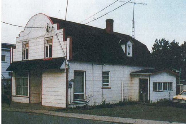
Le 92-92A, rue Saint-Jean-Baptiste, démoli depuis 1990-1991.

Depuis les vingt dernières années, la majorité des bâtiments inventoriés en 1990-1991 n'ont subi pratiquement aucune modification, même très peu de changements de couleur. Il est important de noter, cependant, que certaines maisons en plein cœur du village ont été détruites, dont les 92, 122 et 203, rue Saint-Jean-Baptiste.