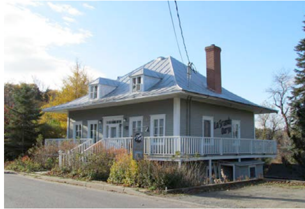
Le 6, rue Viger (Maison Jarvis). IMG_4749.jpg