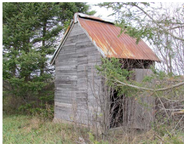
Fumoir au 121, chemin de la Rivière-des-Vases. IMG_4227.jpg