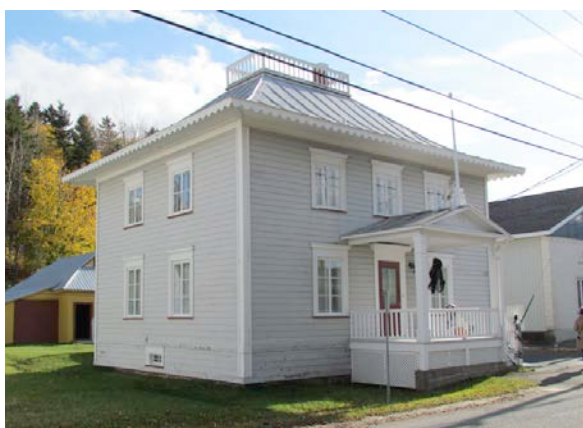
Exemple d'édifice dans un parfait état d'authenticité puisqu'aucune modification majeure n'a été apportée. 131-133, rue Saint-Jean-Baptiste. IMG_4672.jpg