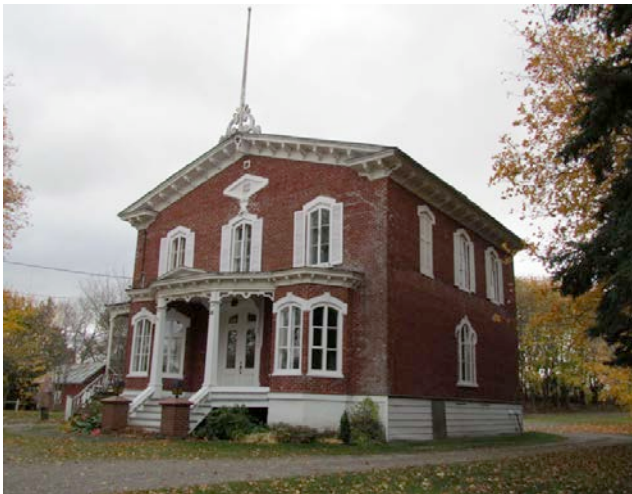
Le 48, rue Villeray. IMG_4311.jpg