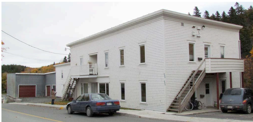
Le 25-27A, rue Villeray en 2011, l'ancien magasin général de Charles Bertrand.

Non loin de là se situe l'ancien magasin général de Charles Bertrand, qui servait aussi de moulin à une certaine époque grâce à la proximité de la rivière Verte.