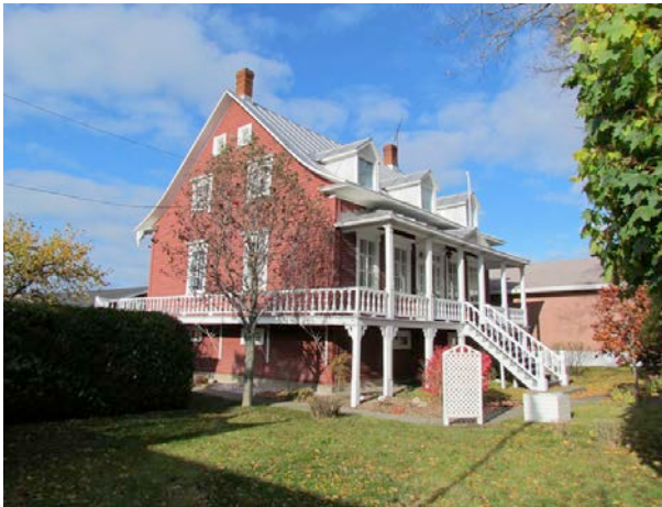
Le 128, rue Saint-Jean-Baptiste. IMG_4698.jpg