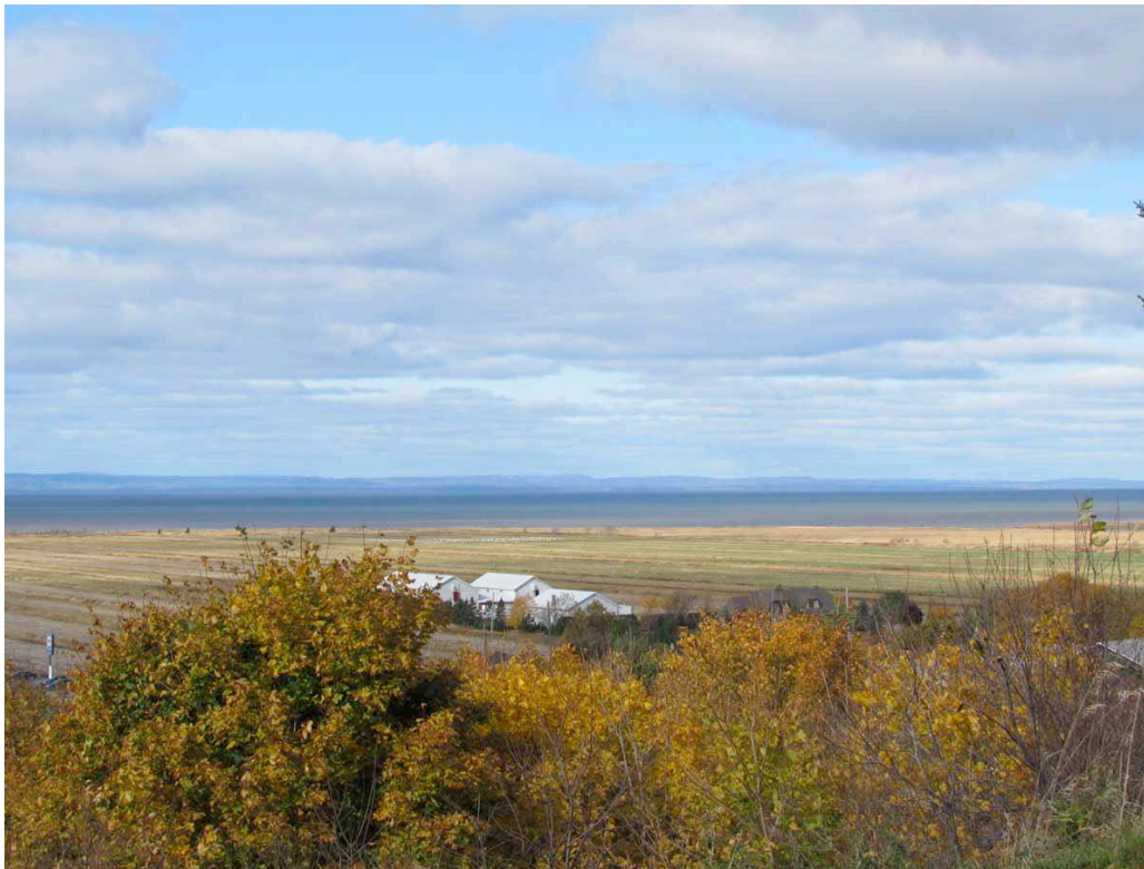
Les berges du fleuve à L'Isle-Verte. IMG_4563.jpg