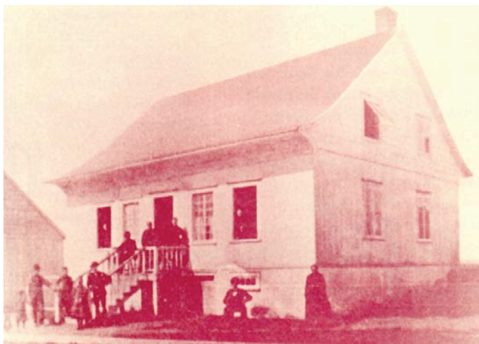
Photo ancienne non datée du 274, rue Saint-Jean-Baptiste. Isle_vert_274_St_Jean_Baptiste.jpg