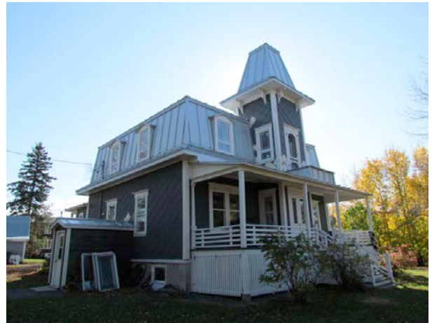
Le 5, rue Béland. IMG_3943.jpg