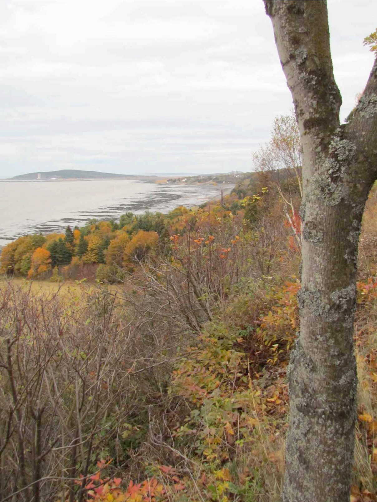
Paysage observable de Cacouna. IMG_3398.jpg