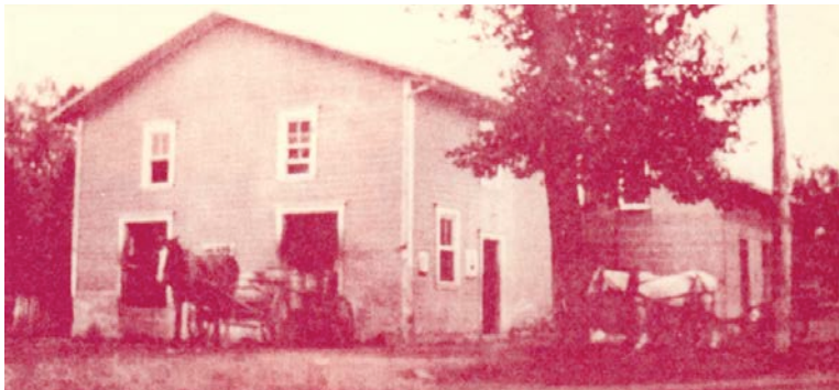
Ancienne crèmerie (beurrerie) de L'Isle-Verte, vers 1920. 35, rue Villeray, L'Isle-Verte. Isle_Verte_35_Villeray.jpg