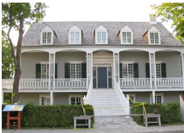
Maison Louis-Bertrand, L'Isle-Verte, monument historique classé et lieu historique national du Canada. maison L-Bertrand_sept2011 001.jpg