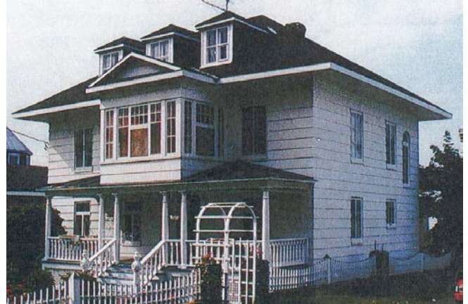
Le 122, rue Saint-Jean-Baptiste, démoli depuis 1990-1991. 122, rue Saint-Jean-Baptiste.jpg