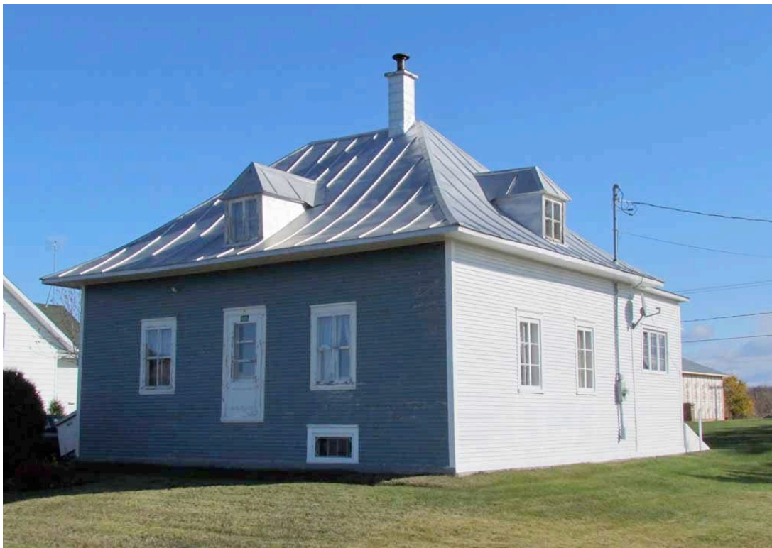
Le 693, chemin Pettigrew. IMG_3979.jpg