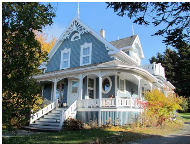
Le 35, rue Saint-Jean-Baptiste en 2011. L'édifice a fait l'objet d'une restauration avec la mise en place d'un revêtement de planche à clin, de chambranles et de planches cornières. Le toit de la galerie a été prolongé, comme c'était le cas probablement à l'origine. On a ajouté un ornement découpé sur le pignon et à la lucarne. Globalement, toutes ces interventions sont fort acceptables. Il aurait été toutefois préférable de mettre en place des fenêtres à guillotine sans carreaux, un modèle davantage compatible avec l'époque et le style de l'édifice.IMG_4116.jpg