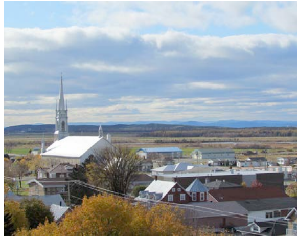
Vue d'ensemble de L'Isle-Verte. IMG_4563.jpg