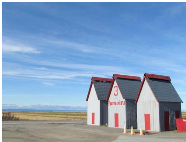
La poissonnerie Les Trois Fumoirs. IMG_3737.jpg

Le fumage des poissons constitue une activité directement associée à l'histoire et au patrimoine de L'Isle-Verte. Il subsiste d'intéressants témoins bâtis de cette activité traditionnelle. Les fumoirs de la poissonnerie Les Trois Fumoirs, en bordure de la route 132, demeurent certes les mieux connus des passants. D'autres fumoirs artisanaux existent encore dont l'un au 121, chemin de la Rivière-des-Vases.