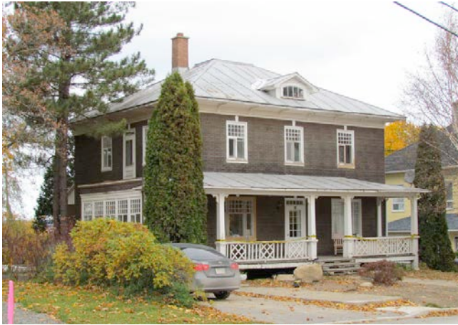
Le 34, rue Villeray. IMG_4288.jpg

La rue Villeray, située près de la rivière Verte, possède un patrimoine bâti important pour la municipalité, notamment grâce à son histoire la liant, entre autres, à la famille Bertrand. En plus de l'ancien magasin général, de la filature et de l'ancienne beurrerie, plusieurs maisons aux caractéristiques patrimoniales authentiques (fenêtres anciennes, éléments décoratifs) singularisent les lieux.