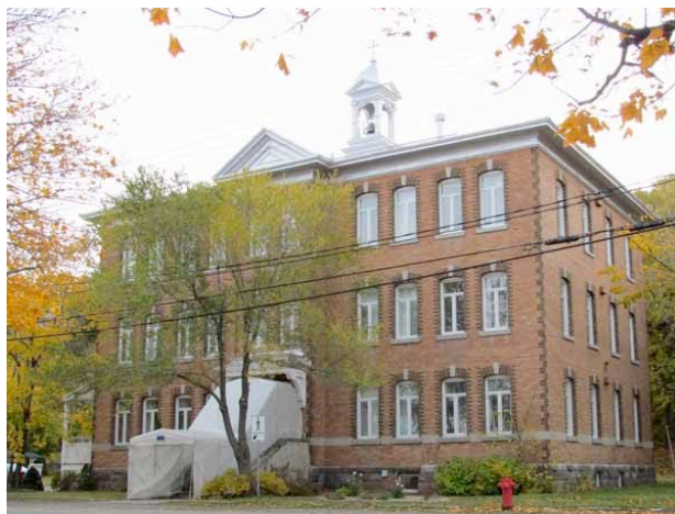
L'ancien couvent en 2011 devenu résidence pour personnes âgées. On a très bien préservé l'imposant édifice malgré le changement de vocation. Seules les fenêtres ont été remplacées, mais le modèle s'apparente à celui d'origine. IMG_4808.jpg