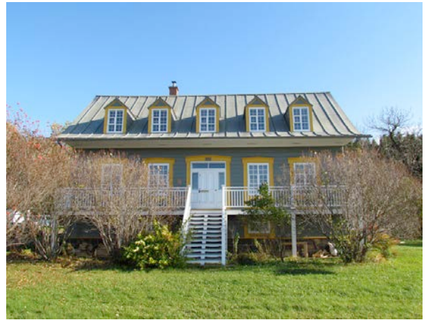
Le 371, route 132 Est. IMG_4089.jpg