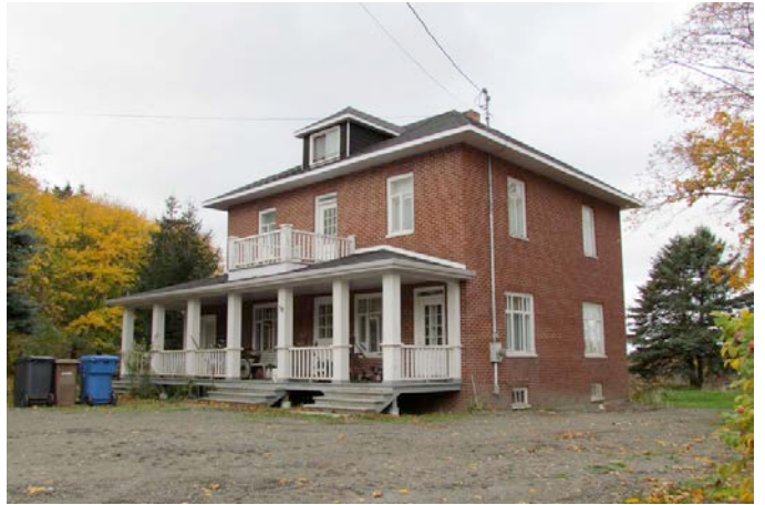
Le 38, rue Villeray. IMG_4291.jpg