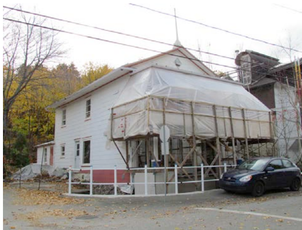
Le 163, rue Saint-Jean-Baptiste. IMG_4828.jpg

Un des seuls exemples d'altérations majeures est la nouvelle « sculpture » du 163, rue Saint-Jean-Baptiste. Située tout près d'une maison classée monument historique, elle détonne dans le paysage.