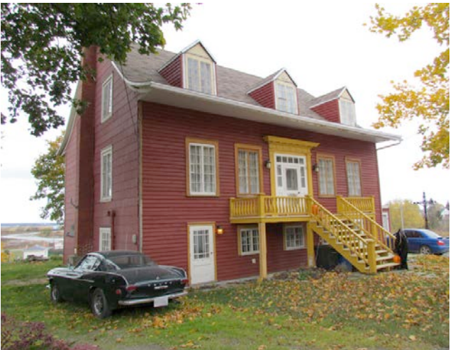
Le 24, rue Villeray. IMG_4366.jpg