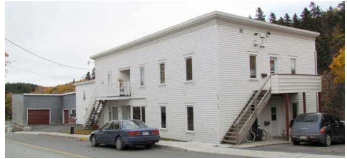
Le 25-27A, rue Villeray en 2011. Cet ancien magasin général a vu sa volumétrie d'origine modifiée et a été transformé au cours des années 1940 en immeuble à logements. Les travaux réalisés ne permettent plus de connaître la fonction d'origine de l'édifice. IMG_4268.jpg