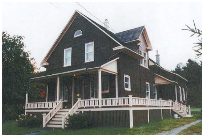
Le 35, rue Saint-Jean-Baptiste en 1990. L_Isle_Verte_35_St_Jean_Baptiste.jpg

Il est important de souligner le cas d'une maison qui a été améliorée à la suite de travaux de mise en valeur. Il s'agit du 35, rue Saint-Jean-Baptiste dont l'apparence a été bonifiée par rapport à la situation qui prévalait en 1989.