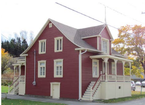
Édifice présentant un bon état d'authenticité malgré l'utilisation d'un matériau moderne qui s'apparente à la planche à clin traditionnelle. 83, rue Saint-Jean-Baptiste. IMG_490.jpg

En outre, une valeur patrimoniale a été attribuée à chacun des biens inventoriés. Elle se veut une synthèse des critères énoncés plus haut. En voici le résultat.