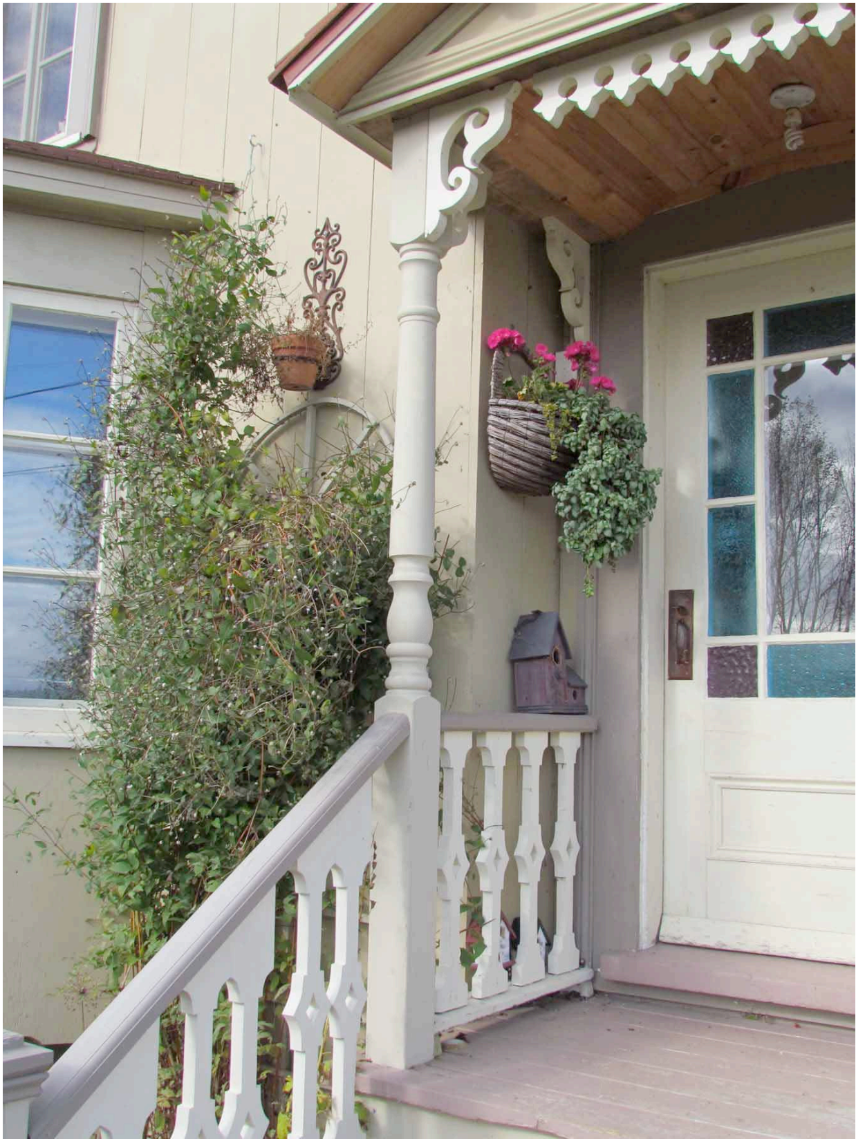
279, Petit-2 e Rang, Cacouna. IMG_2975.jpg