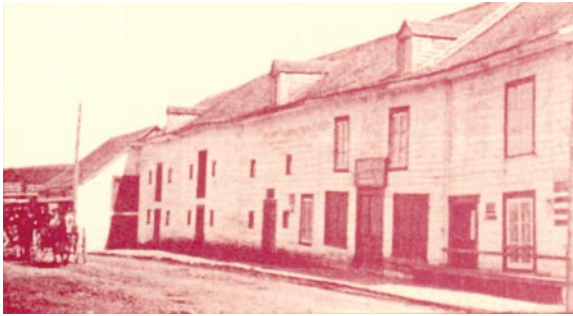
Le 25-27A, rue Villeray vers 1900. Isle_Verte_25_27a_Villeray.jpg

Au fil du temps, le cadre bâti ancien de L'Isle-Verte a connu une évolution, marquée par de bonnes comme par de mauvaises interventions. Certains des édifices d'intérêt patrimonial ont connu des transformations plus importantes que d'autres.