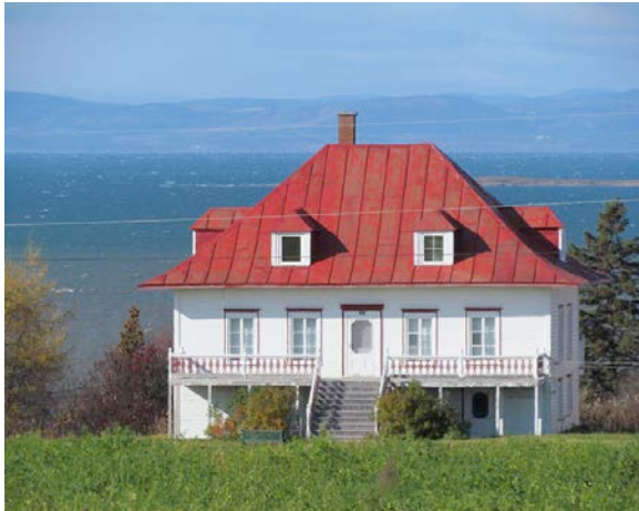
Le 679, chemin Pettigrew. IMG_3990.jpg

Le patrimoine bâti de la municipalité de L'Isle-Verte est étroitement lié à la qualité de son environnement naturel. Au pied des collines, L'Isle-Verte se trouve à la limite du fleuve qui s'approche et se retire au gré des marées, laissant derrière de grandes herbes dorées. Les maisons sont positionnées afin de profiter au maximum des points de vue et panoramas vers le fleuve.