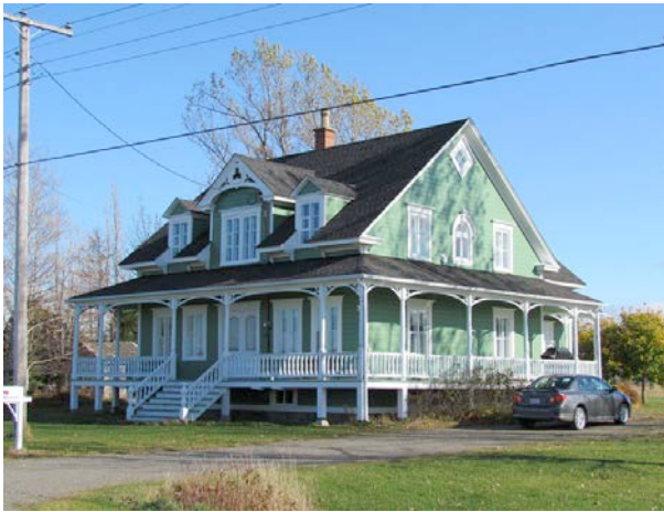
Le 587, chemin Pettigrew. IMG_3970.jpg

Se démarquant par la qualité de ses bâtiments anciens, le patrimoine bâti dans la municipalité de L'Isle-Verte est en très bon état. En fait, plus de la moitié des bâtiments inventoriés ont une cote d'authenticité supérieure ou bonne. De plus, plusieurs constructions situées dans la périphérie de la municipalité sont, elles aussi, bien préservées. Évidemment, comme dans d'autres municipalités de la MRC de Rivière-du-Loup, on note la présence de nombreuses constructions utilisant des matériaux contemporains. Néanmoins, en règle générale, plusieurs propriétaires ont à cœur la préservation de l'authenticité du patrimoine bâti.